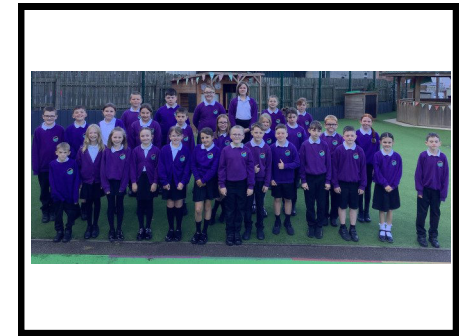
Yn y llaw fach mae'r holl fyd