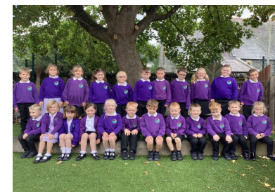
Yn y llaw fach mae'r holl fyd